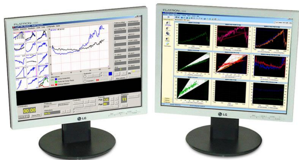
ECG DIGITAL ELITE PARA CENTRAL GRÁFICA DE DADOS METABÓLICOS