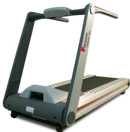
ESTEIRA CENTURION 300