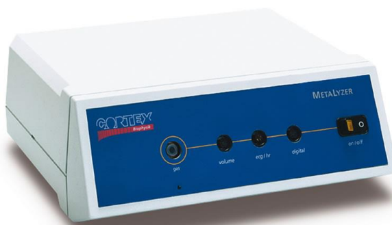
ANALISADOR METABÓLICO METALYZER