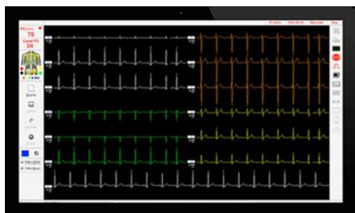
ELETROCARDIOGRAFO DIGITAL WINCARDIO